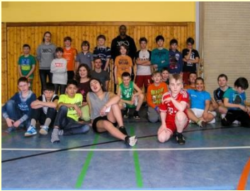
Die erfolgreichen Basketballer