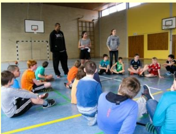
... und alle lauschen.