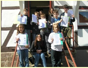
Die orange Klasse mit den Redakteuren des Bloganjesa