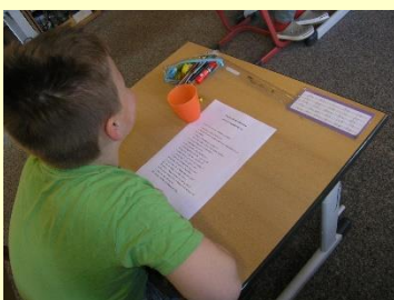
... und beantwortet alle Fragen.

1. Wie alt können Schnecken werden? Weinberg Schnecken können bis zu 19 Jahren alt werden, Bänderschnecken können bis zu 8 Jahren alt werden