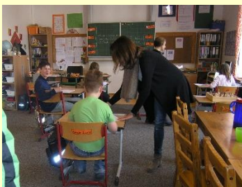
Die orange Klasse bereitet sich auf den Besuch der Redaktion vor....