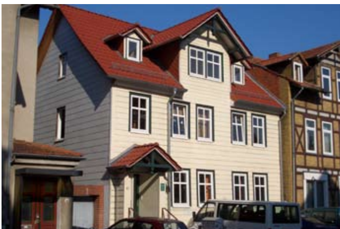
Tagesgruppe Leinebrücke I u. II